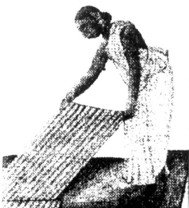
Femme faisant sécher la toile