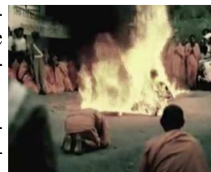
Immolation d'un moine, Saigon 1963 (capture d'écran)

Des méthodes différentes ont été utilisées pour ces causes. L'immolation par le feu d'un moine au Sud Vietnam en 1963, de l'étudiant tchèque Jan Palach en 1968, de l'étudiant tunisien (qui était devenu vendeur ambulancier par nécessité économique) en décembre 2011 restent des cas très particuliers dans cette liste. Les événements en ex-Yougoslavie, Tunisie, Irak, Egypte, Libye, Syrie, etc. font encore allonger la liste.